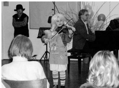
Nastop v maskah