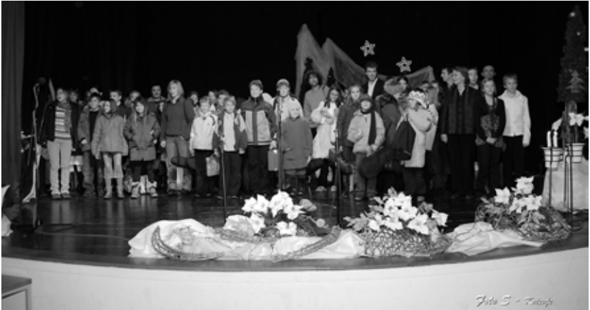
Božično – Novoletni koncert, 17. 12. 2007