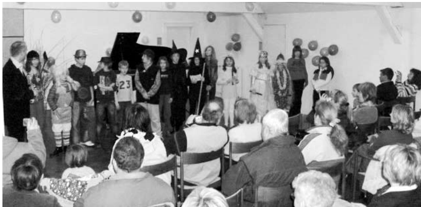
Na pustni nastop, 6. februarja 2008, se je prijavilo 30 učenk in učencev, zato sta bila organizirana dva nastopa.